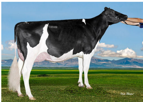
BGP MODESTY IMOGENE THIRD DAM